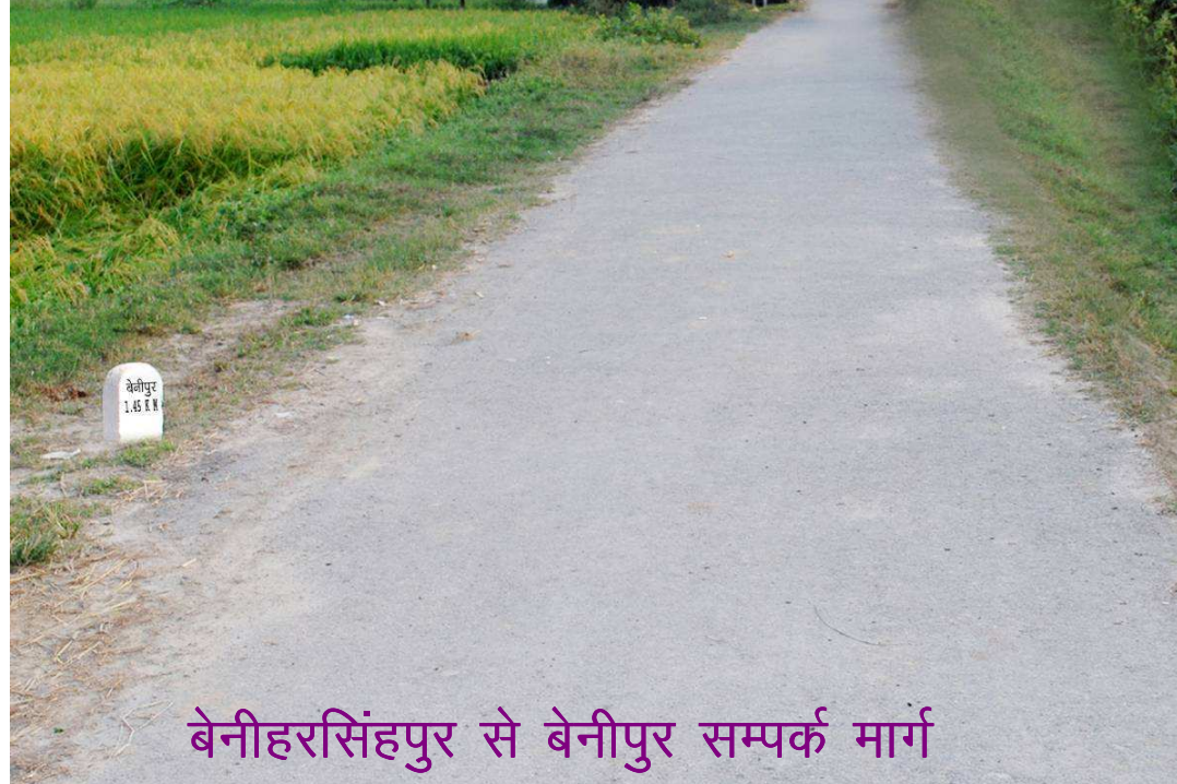
बेनीहरसिंहपुर से बेनीपुर सम्पर्क मार्ग